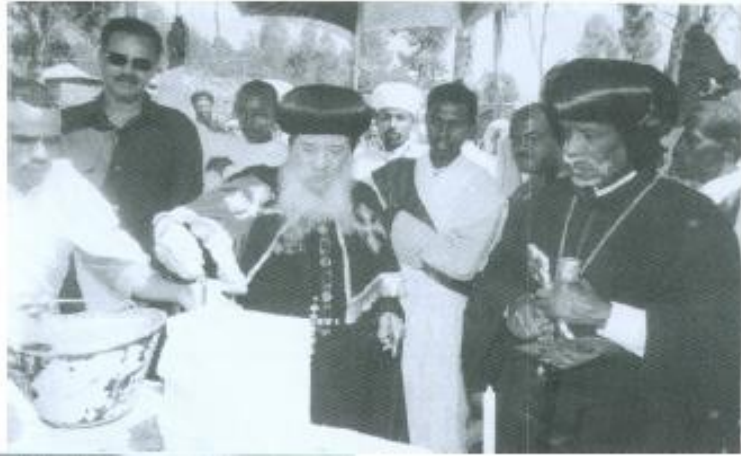
ፓትርያርክ እንጦንዮስ፡ ኣቶ ኢሳይያስ ኣፈወርቂ መራሒ ሃገር ኤርትራ። ፓፕ ስኖዳ 3ይ ኣብ ዕዳጋሓሙስ ኣስመራ (ከባቢ እንዳ ስላሴ) እምኒ-መሰረት መንፈሳዊ ኮለጅ ከንብሩ ከለዉ።